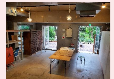
⑧ こうさくのひろば

至誠学園の正門を通り、まっすぐ進んだ先にある階段をおりて、右手側にあります。プロペラの看板が目印です。